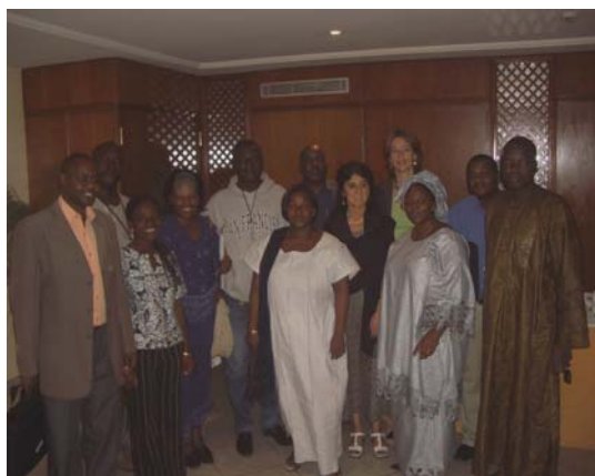
Participants to the Regional Launch meeting in Bamako, June 2006

La communication, la sensibilisation et la mobilisation communautaire sera au centre de la stratégie des organisations dans les industries du poisons et du tabac.