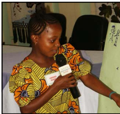
Un ancien enfant travailleur explique comment elle voit une future sans travail des enfants.

Community-based Innovations to Reduce Child Labor through Education