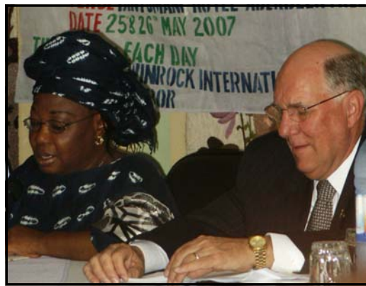
Le Ministre des Affaires Sociales, Genre & de l'Enfant et l'Ambassadeur des États Unis à l'ouverture.